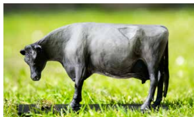
Uniek beelde Gouden Grasspriet