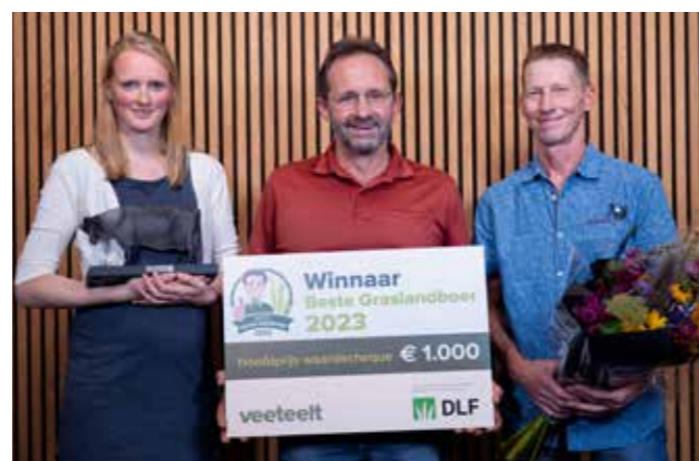
Uitreiking winnaars Beste Graslandboer 2023